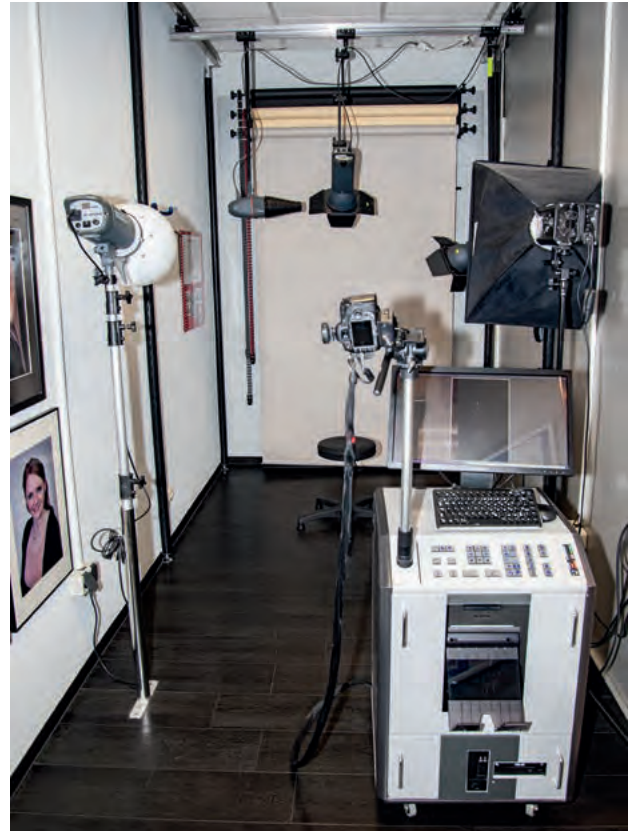
Das Studio wird überwiegend für Pass- und Bewerbungsbilder, aber auch für Portrait-aufnahmen genutzt.