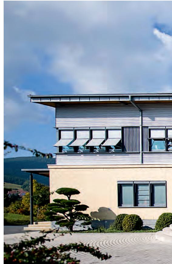
Seit der Gründung residiert VST in Saalfeld, mitten im Thüringer Wald.

Welche wirtschaftliche Bedeutung vor allem das Pass- und Bewerbungsbild als „Brot-und-Buttergeschäft“ für den Fotofachhandel und die Portraitfotografen besitzt, ist allen Beteiligten nicht erst durch die „unruhestiftende“ Passbildnovelle bewusst geworden. Ermöglicht dieses Portraitsegment doch gute Erträge bei vergleichsweise geringem Aufwand. Die Kosten für den Ausdruck des Vierersets liegen – unabhängig vom verwendeten Printer – selbst bei einer konservativen Kalkulation deutlich unter einem Euro. Dem steht ein inzwischen durchaus üblicher Verkaufspreis von 15 bis 25 Euro fürs Pass-Set gegenüber. So setzen einige VST-Kunden das System primär oder ausschließlich für ihre Passbild- und Bewerbungsbildfotografie ein, „weil es sich auch mit 15 Pass-Sets am Tag schon rechnet“, so Andreas Plank. Dass das Geschäftsmodell funktionieren kann, beweist unter anderem eine VST-Kundin. Die Fotografin fertigt ausschließlich Passfotos und einfache Bewerbungsbilder an. Das Set für 17,90 Euro, wovon sie täglich aber bis zu 60 Stück verkauft. A. Plank kennt die Praxis, schließlich war er vor seinem Wechsel als Vertriebsleiter