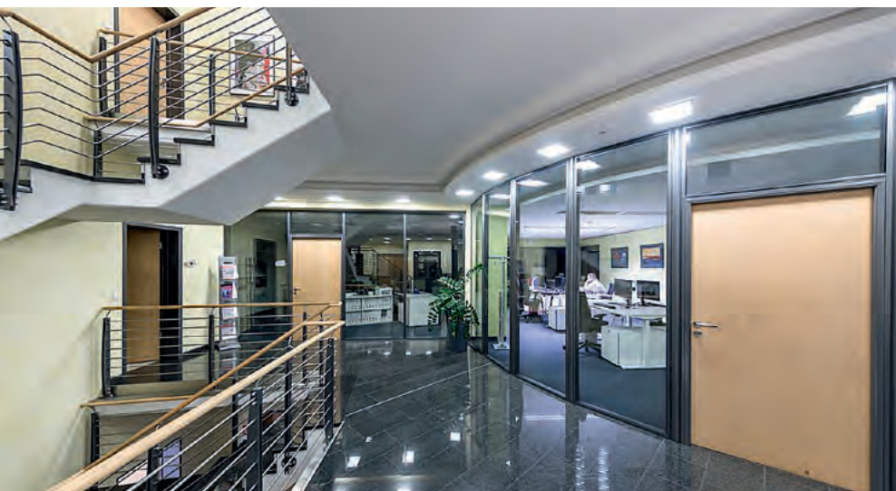
Modernes Interieur und fortschrittliche Technik spiegeln sich auch im VST-Gebäude wider.