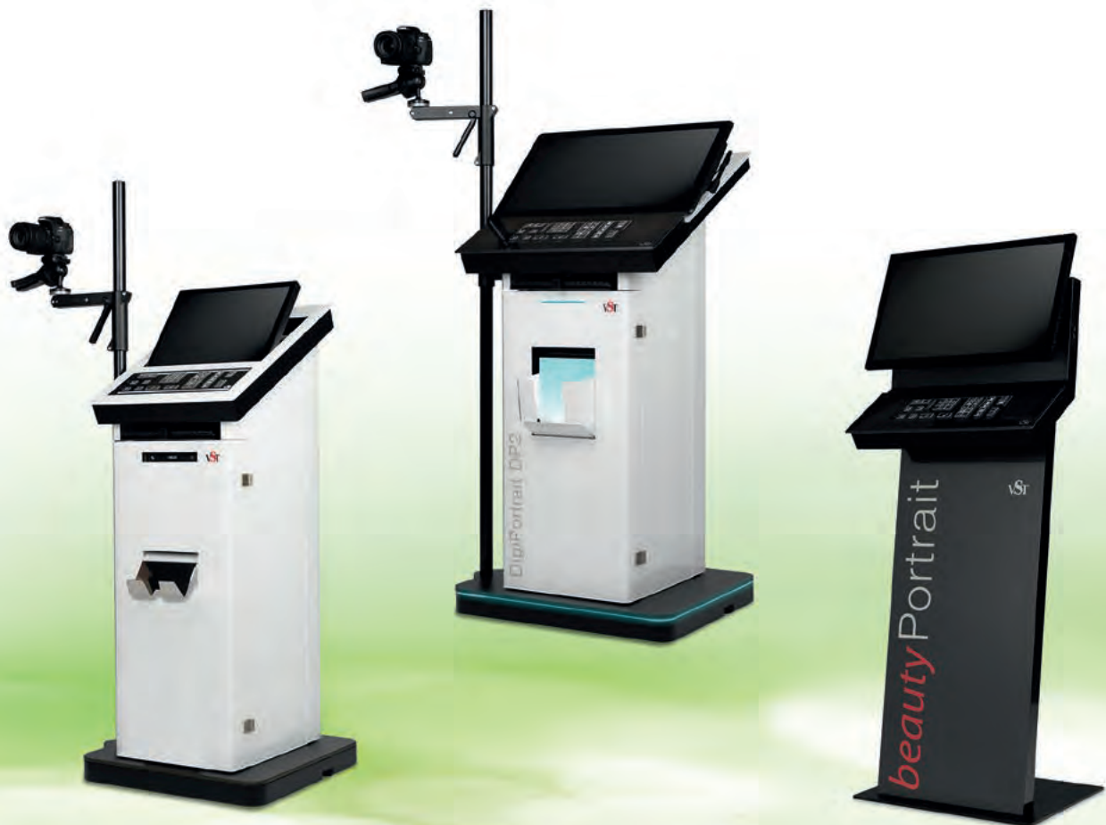
Die aktuellen VST-Systeme im Überblick.