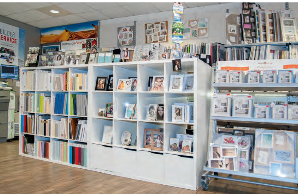
Attraktive Warenpräsentation in einem Element in der Mitte des Geschäfts.