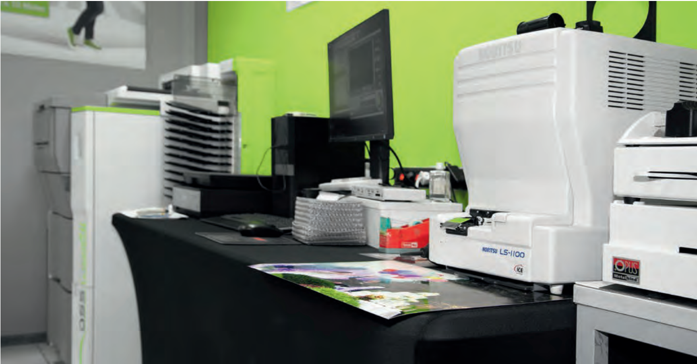
Teilansicht des Ausarbeitungsbereichs mit (v.l.) Inkjetlab, EBV-Arbeitsplatz mit Flachbett- und Noritsu-Filmscanner. Rechts ragt ein Teil des Opus-Buchbindegeräts ins Bild.