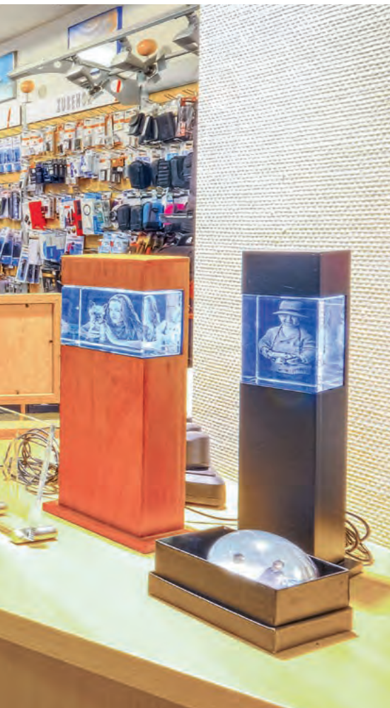
Das Geschäft erstreckt sich quer durchs Haus von der Front- bis zur Rückseite des Gebäudes.

R. Duderstadt: Praktisch gar nicht, wir haben ihn aber auch nicht kommuniziert. Nun fand der Wechsel auch in einer Phase statt, die noch stark von Corona-Beschränkungen geprägt war. Unterschiede beim Papier fallen allenfalls im direkten Vergleich auf. Die Bildqualität ist bestens und entspricht dem Bildeindruck, den die Kunden vom Display ihrer Smartphones kennen. Die Farben sind knalliger, gesättigter, schärfer als bei einem Bild vom Farbfilm. Da war ein Grün noch ein Blattgrün, heute ist es eher ein Giftgrün. Mit den Displays hat sich auch das Sehen der Leute verändert. Die Papierbilder, die wir heute mit dem Inkjetlab produzieren, sind dichter am Bildeindruck als es die chemischen Bilder einst waren. Wir müssen akzeptieren, was dem Kunden gefällt, wir sind ja keine Farblehrmeister.