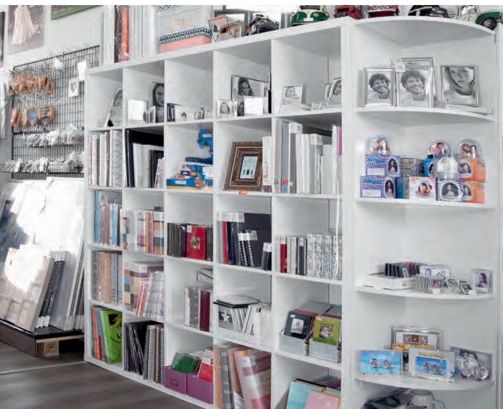
Zwischen den Terminals und der Wand zum 37 Quadratmeter großen Studio wird ein Teil des Rahmen- und Albenangebots präsentiert.

F. Nicoletti: Seit der Installation unseres Inkjetlabs bieten wir konsequent allen Kunden unsere Smart-Picture-Creation-App von Noritsu an. Für uns ist die App der Motor der Zukunft. Wir haben einen eigenen Flyer kreiert, den wir allen Amateurbildkunden, aber auch unseren Pass-, Bewerbungsbild- und Portaitkunden mitgeben. Jeden Kunden sprechen wir auf die Onlinebildbestellung an. An meinem Smartphone führe ich vor, wie leicht und einfach mit der SPC-App das Bildbestellen von daheim und unterwegs ist. Im Drogeriemarkt stehen die Leute in der Schlange und müssen warten, bis ein Gerät frei ist und die Bilder geprintet sind. In der Zeit sind die Bilder bei uns schon fertig und abholbereit, wenn der Kunde sie zuvor über die App bestellt hat. Aber Achtung! Je mehr man erzählt, was sich mit der App alles machen lässt, um so skeptischer werden manche Kunden, weil sie annehmen, man wolle ihnen etwas verkaufen und sie binden. Die Altersgruppe der Dreißig- bis Fünfzigjährigen ist da besonders skeptisch.