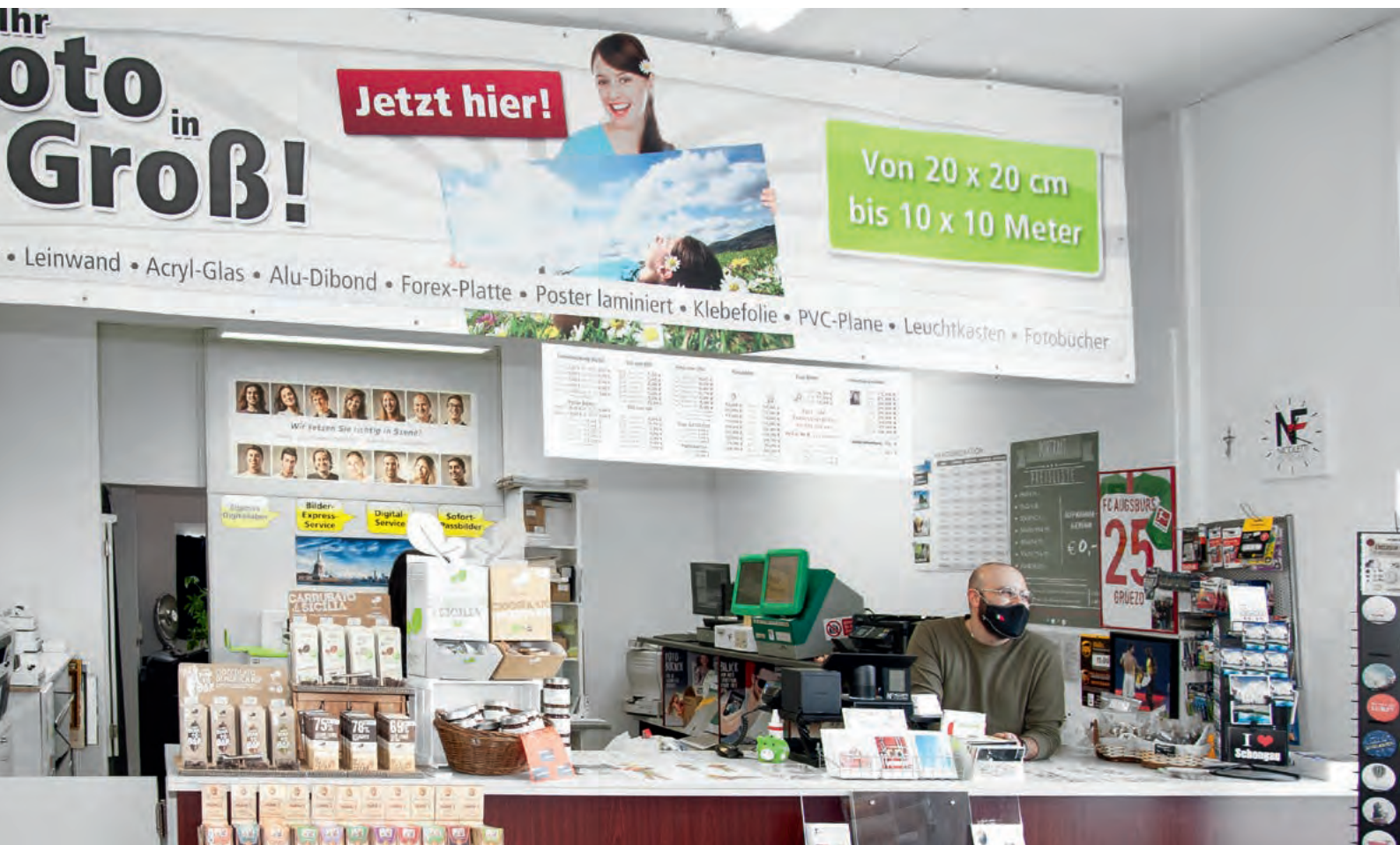
Für Kunden unübersehbar ist das Werbebanner und darunter die übersichtlich gegliederte Preisübersicht der wichtigsten Bildprodukte.

an. Sie unterscheiden sich fotografisch wie preislich. Fürs biome- trische Vierer-Set berechnen wir 14,99 Euro gegenüber 12,99 Euro fürs „Normal-Passbild“. Die Zwei-Euro-Differenz zieht sich durch die gesamte Staffelpreisliste. Unabhängig von der Art des Pass- bilds berechnen wir für die Kombination aus Pass-Set und Bild- datei 24 Euro. Wer nur die Bilddatei des Passbilds haben möchte, zahlt 20 Euro. Die Entwicklung des E-Passbildes verfolgen wir genau, auch um uns rechtzeitig zertifizieren zu lassen. Wir beur- teilen die Veränderung grundsätzlich positiv, weil die Zertifi- zierung wahrscheinlich zu einer gewissen „Marktberuhigung“ führen wird.