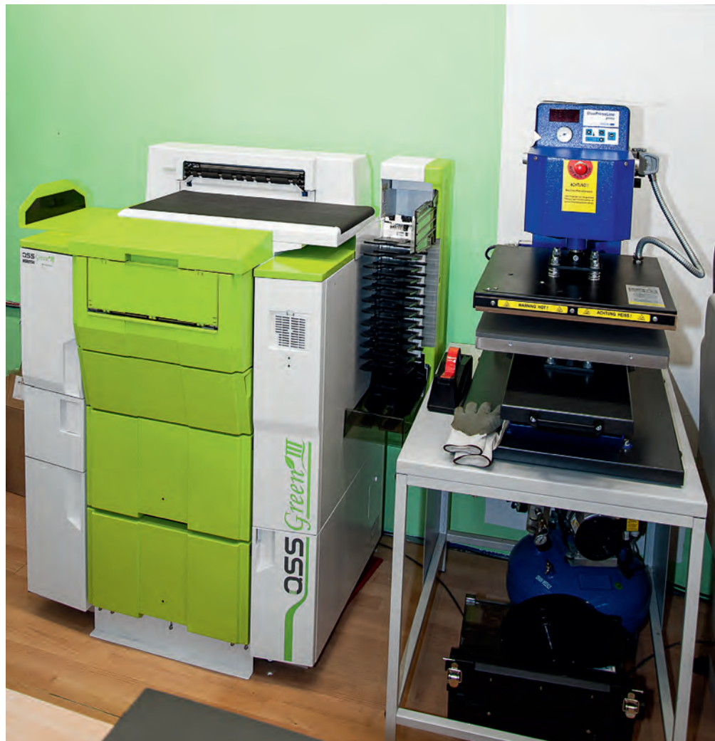
Hinter den Annahmeterminals, für Kunden gut sichtbar, befinden sich das Noritsu-Inkjetlab, rechts daneben eine T-Shirt-Press.

F. Schöner: Ich schätze, dass 75 Prozent mit dem Smartphone fotografieren. Die restlichen Kunden nutzen Kameras und kommen zur Bildbestellung mit Speicherkarten oder USB-Sticks zu uns. Inzwischen kaufen und nutzen auch immer mehr ältere Kunden ein Smartphone als Kameraersatz. Bei der Bedarfsanalyse fragen wir die Kunden natürlich, worauf sie beim Smartphone besonderen Wert legen. 98 Prozent der Kunden, vom Kind bis zum Greis, sagen dann „auf die Kamera“ und auf die „WhatsApp-Funktion“. Das wissen auch die Hersteller. Deshalb werden bei neuen Smartphone-Modellen fast nur noch die Fotofunktionen erweitert und optimiert.