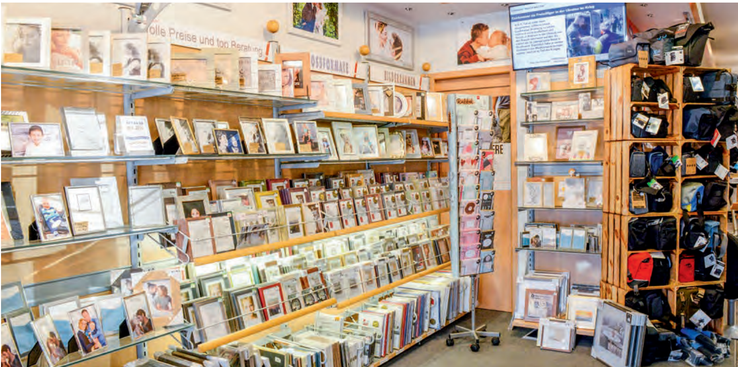
Links vom Eingang erstreckt sich das große Rahmenangebot.

Inkjetlab auch einen beachtlichen Anteil großer Bilder bis 30 x 45 cm oder als Panorama bis 30 x 140 cm. Für noch größere Formate nutzen wir unseren Plotter. Natürlich bieten wir Kunden auch zu Großvergrößerungen und Portraitbildern immer Rahmen an. Aus gutem Grund führen wir ein großes Rahmensortiment mit Leisten in unterschiedlichsten Formaten und Ausführungen. Jenseits der Standardformate produzieren wir zwangsläufig viele Pass- und Bewerbungsbilder, die wir – wie auch unsere Portrait-Prints – alle mit dem Inkjetlab ausgeben.