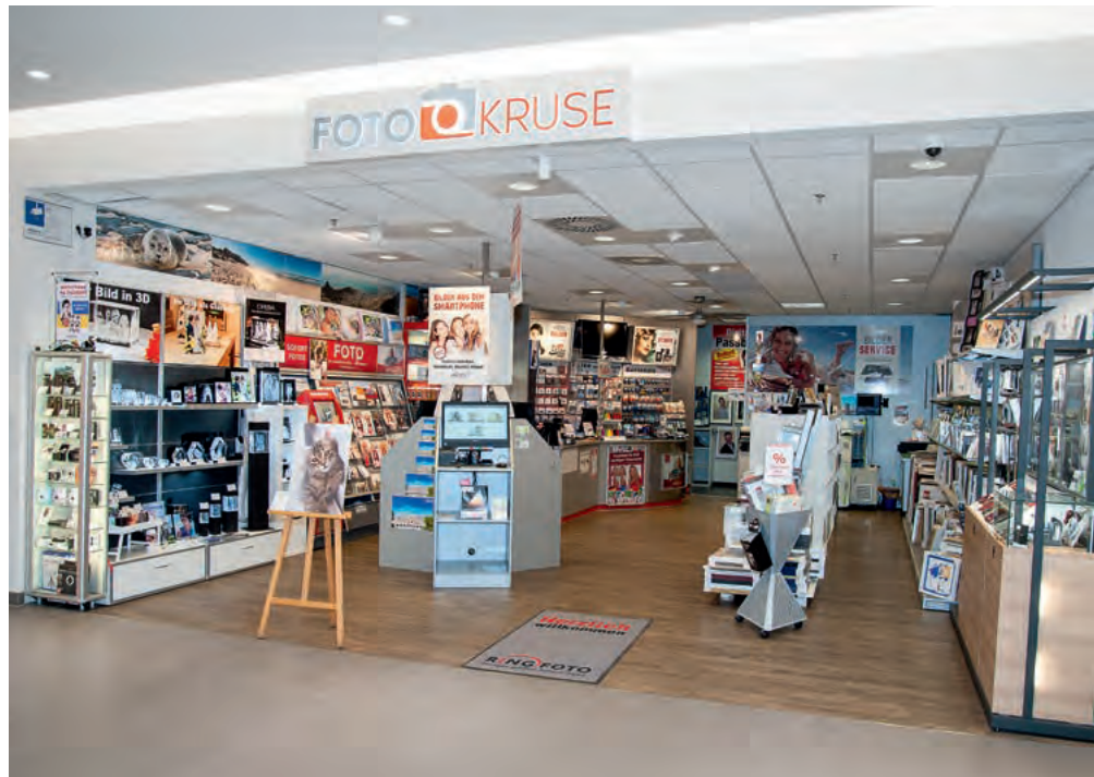
Im Center in einer 1A-Lage befindet sich das Geschäft an einem stark frequentierten Gang zwischen zwei Center-Bereichen.