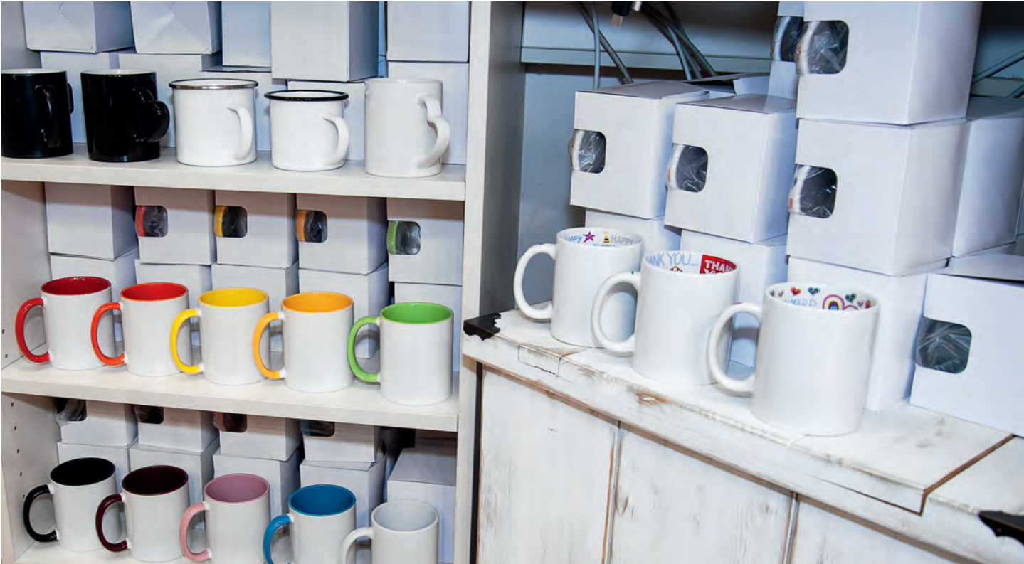
Diese Artikel werden besonders gern von österreichischen Kunden gekauft.

Da lockt das schnelle Geld. Wir pflegen – und zwar schon immer – ein kundenorientiertes Verkaufen. Damit halten und gewinnen wir in beiden Geschäftsbereichen immer wieder neue Kunden.