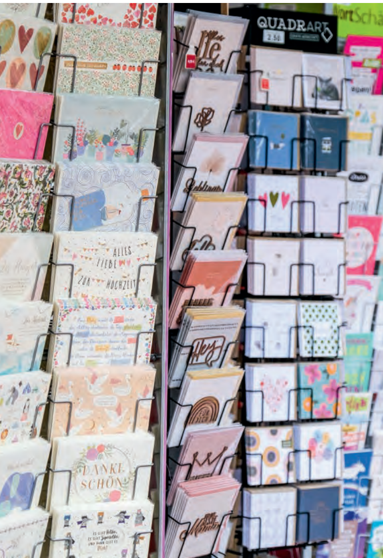
Diese Mitnahmeartikel sind für Kunden attraktiv und für den Fotohändler lukrativ.