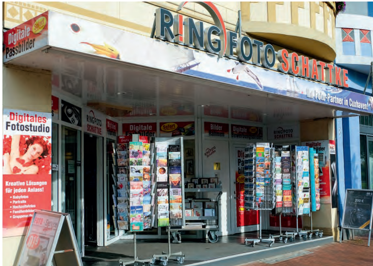
Mit einer auffälligen Präsentation vorm Eingang wird die Aufmerksamkeit der Kunden und Passanten auf das Fotogeschäft gelenkt.