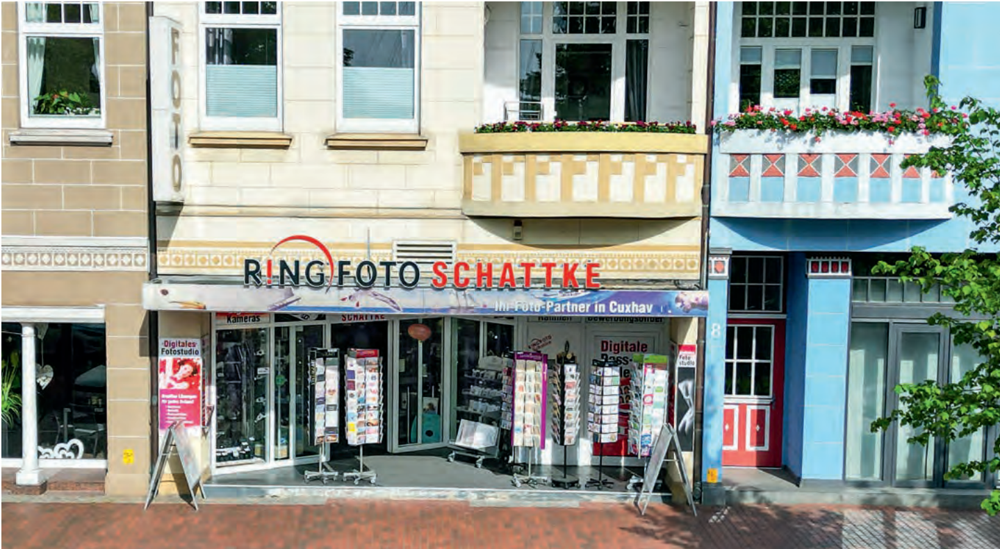
Das Fotogeschäft auf der Deichstraße in Cuxhaven ist ein bekannter Anziehungspunkt für Fotokunden aus der Region wie für Touristen.