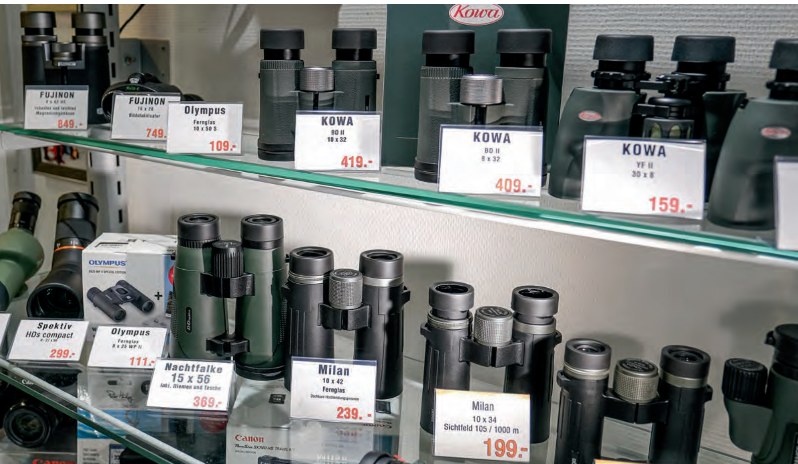
Sind Bestandteil des umfangreichen Sortiments und unter anderem bei Touristen beliebt.

eine Klappkarte mitgeben, in der wir ihm mit einer Schritt-für-Schritt-Anleitung erklären, wie schnell und einfach er bei uns an seine Bilder kommt. Da unsere Ansprache nicht fruchtet, muss es andere Gründe für die Bild-Abstinenz dieser Kundengruppe geben. Sei es, dass sie die Aufnahmen auf den Speicherkarten oder auf anderen Speichermedien horten, sei es, dass sie sich die Aufnahmen nur auf einem großen Fernseher oder PC-Monitor ansehen. Alle diese Überlegungen sind spekulativ. Genaues wissen wir nicht. Am plausibelsten erscheint uns noch die Vermutung, dass die Käufer hochwertiger Ausrüstungen mit den Kameras überwiegend filmen und kaum oder gar nicht fotografieren. Kunden, die mit einer „Kompakten“ fotografieren, könnten damit zwar auch filmen, nutzen dafür aber ihr Smartphone.