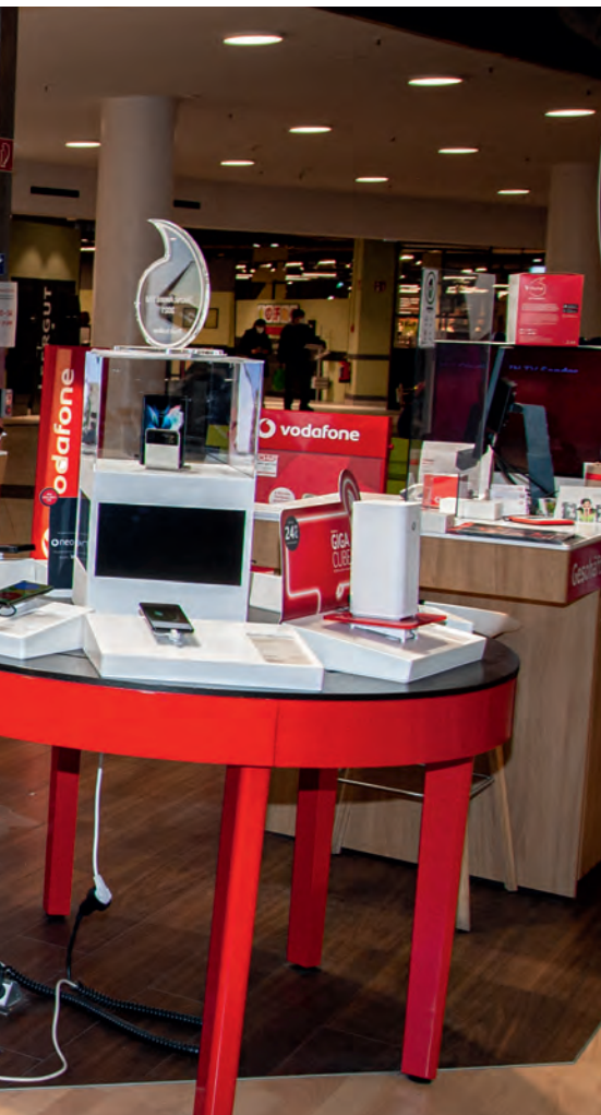
Der Mobilfunkbereich mit eigenem Tresen zieht sich über eine Längsseite des Geschäfts.

F. Schöner: Unsere Foto-Kundschaft kommt aus dem näheren Umland im Umkreis von gut 15 km um diesen Standort. Mobilfunkkunden ziehen wir aus einem Umkreis von etwa 40 km an. Bei „Foto“ und „Mobilfunk“ gibt es keine Unterschiede in der Kundenstruktur. Zu uns kommen Leute aus allen Bevölkerungsschichten. Uns ist jeder Kunde gleich gut und gleich recht.