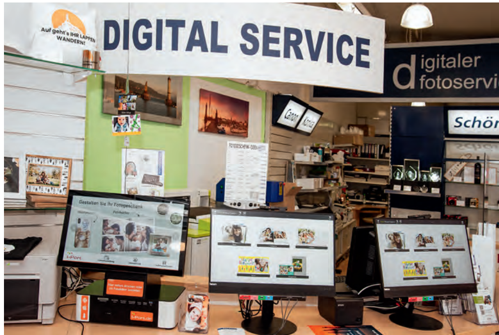
Die Terminalzone ist Bestandteil des Ausarbeitungsbereichs.