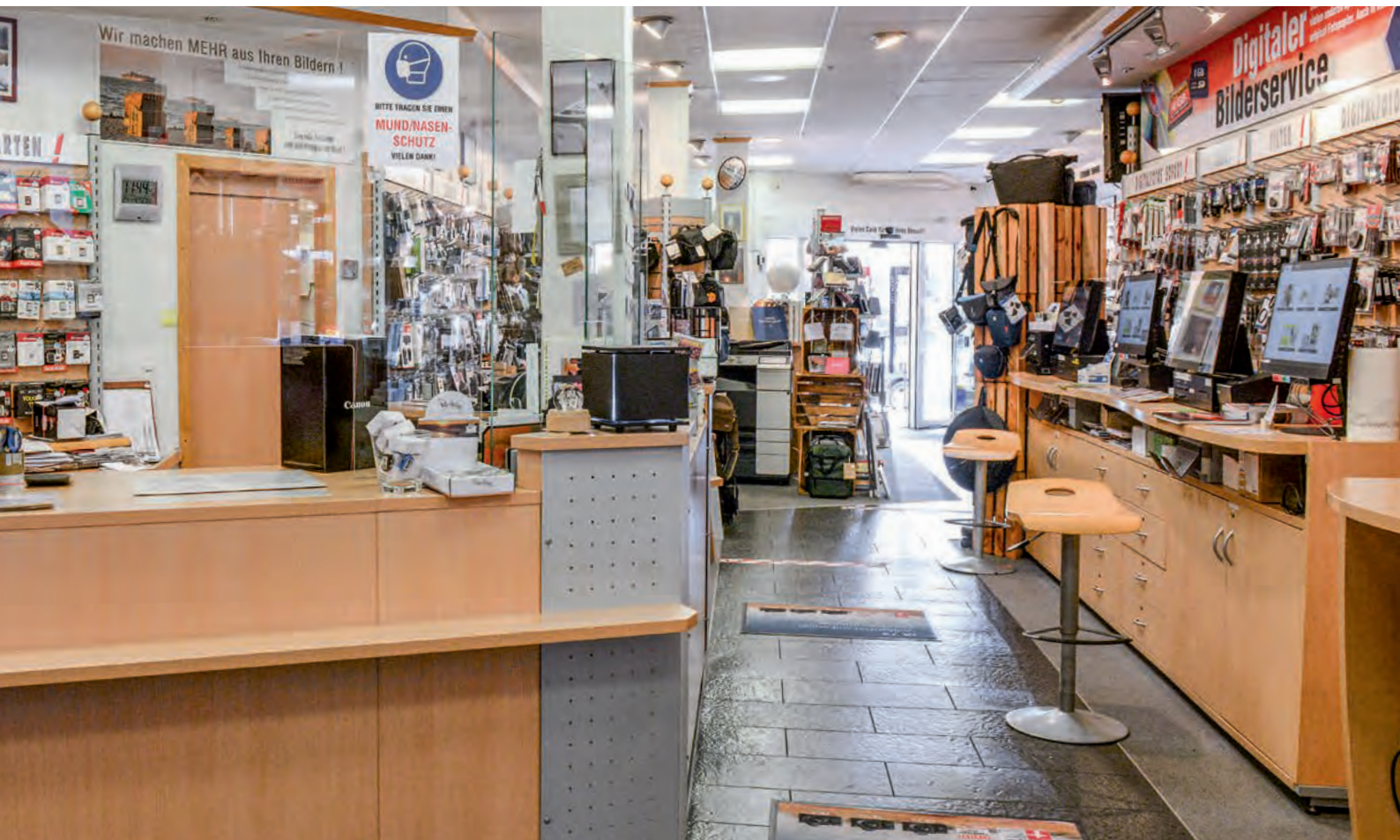
Der große Tresen (links) hat einen zentralen Platz im Geschäft.