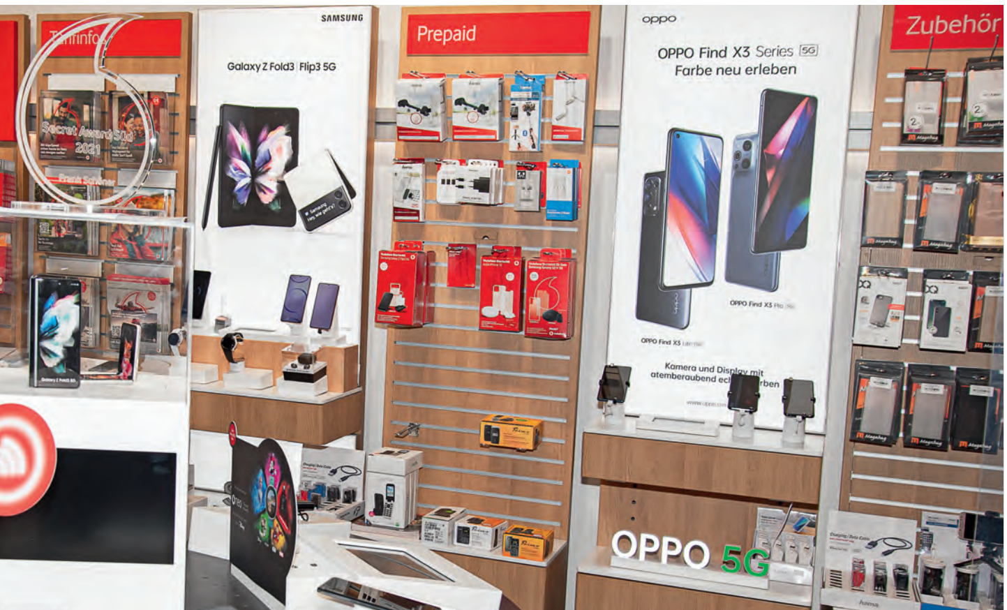
Klar strukturiert mit hohem Wiedererkennbarkeitsfaktor zeigt sich der Vodafone-Shop.

Ist die bekannte „Lindauer Insel“, der historische Altstadt kern von Lindau, kein Wettbewerber?