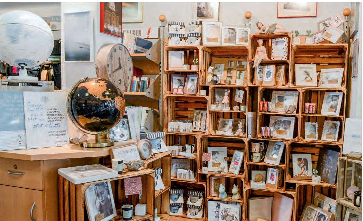
Rechts vom Eingang treffen Kundinnen auf eine sehr „frauenfreundliche“ Präsentation.

R. Duderstadt: Bei den Standardformaten dominiert eindeutig das 10x15-cm-Bild, weil die meisten Leute das Format schon sehr lange kennen. Gemessen an den Stückzahlen macht es deutlich mehr als die Hälfte aller von uns geprinteten Bilder aus. Einen beachtlichen Anteil haben auch 13x18-cm-Bilder. Sie eignen sich gut fürs Einrahmen, sind zum Mitnehmen aber schon zu groß. Wir bedienen aber auch Kunden, die nach wie vor das 9x13-cm-Bild favorisieren. Selbst 7x10-cm-Bilder werden gelegentlich noch verlangt. Durch zumeist junge Kunden, die sich in sozialen Netzwerken tummeln, hat die Nachfrage nach quadratischen Bildern massiv zugenommen, zu denen wir auch erfolgreich quadratische Rahmen verkaufen. Die meisten Amateuraufnahmen, die wir zum Printen erhalten, kommen zu über 80 Prozent vom Smartphone, und zwar von Kunden jeden Alters. Im Amateurbildsegment wie im Studiobereich produzieren wir mit unserem