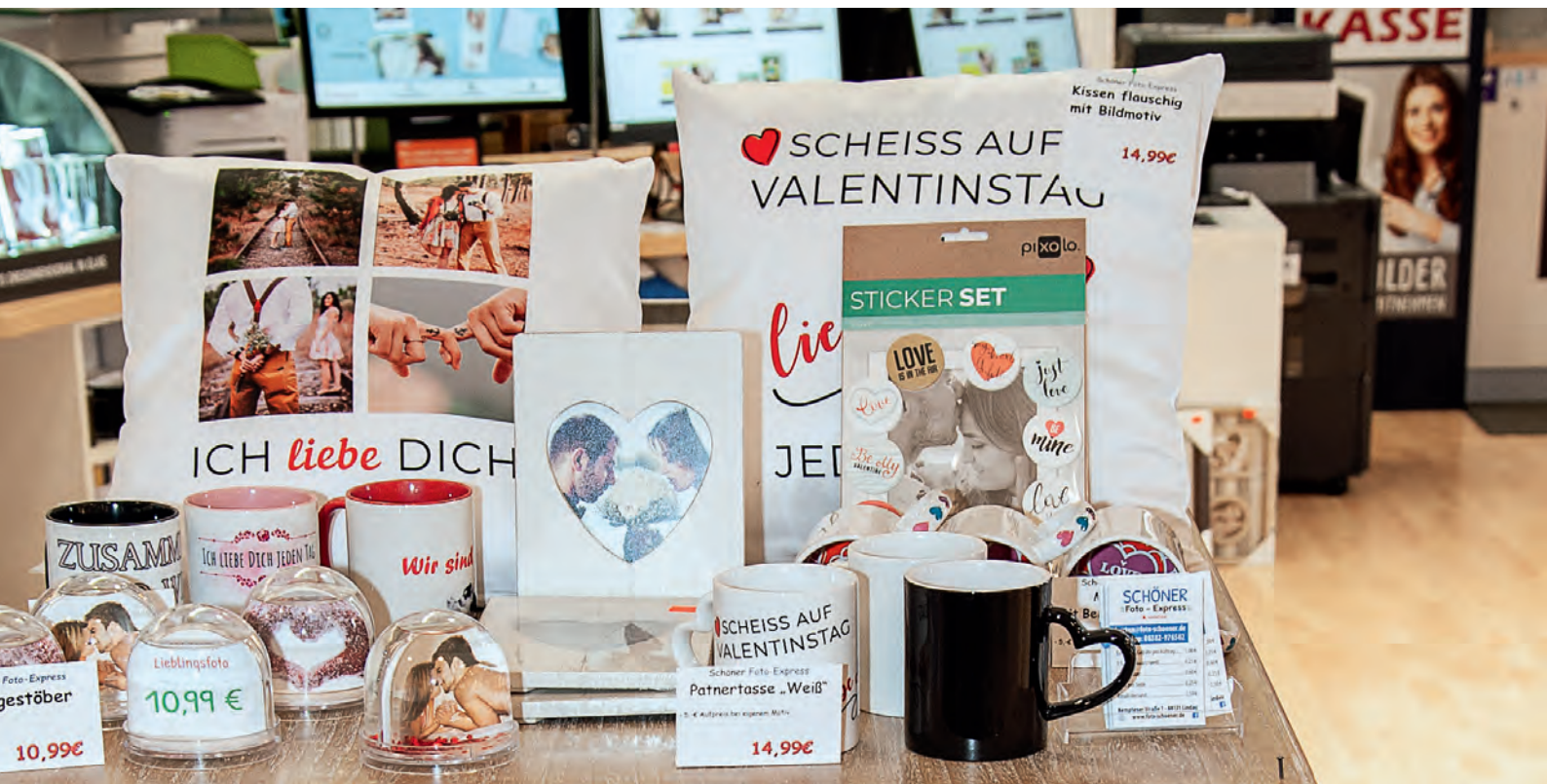
Im Eingangsbereich vor der Fotozeile wirbt eine attraktive Dekoration für nette Begehrlichkeiten.