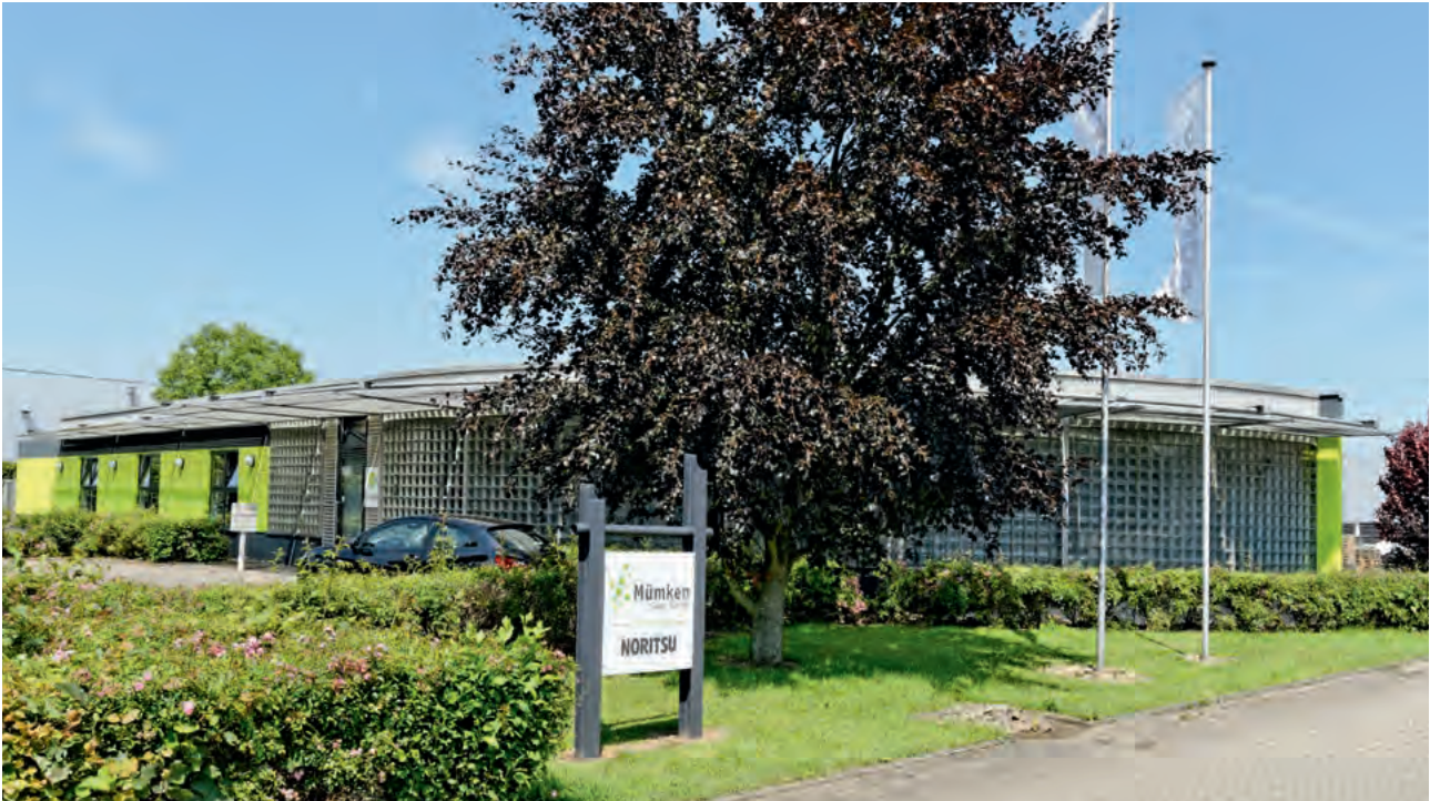
Seit 2014 ist die Mümken Sales GmbH in Hünxe ansässig. Das 1000 m 2 große Firmengelände beherbergt unter anderem das Firmengebäude mit Büros, einem großen Zentrallager und einem Showroom mit vorführbereiten Geräten.