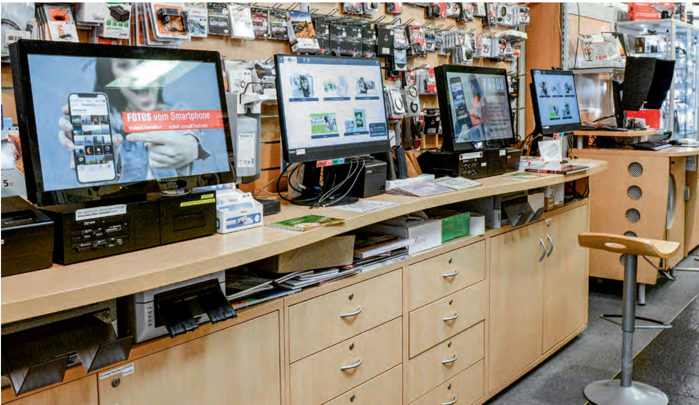
Vier Terminals stehen in der Terminalzone für Bilderkunden bereit.

„Wir müssen akzeptieren, was dem Kunden gefällt, wir sind ja keine Farblehrmeister.“