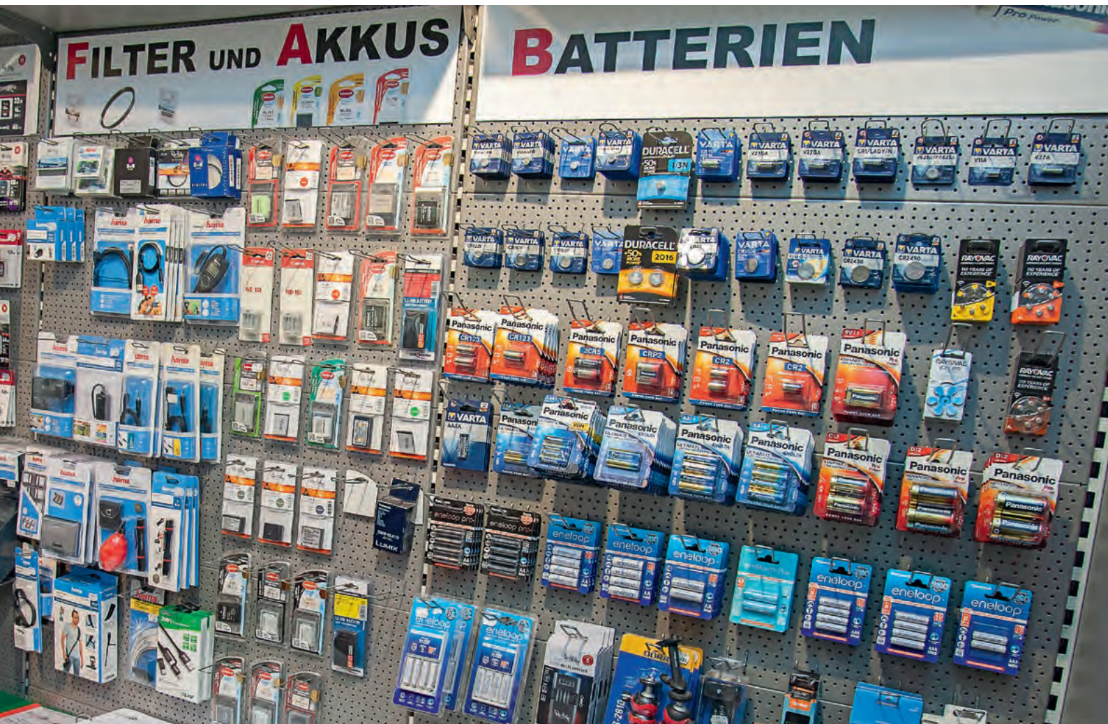
Bestandteil der Thekenzone ist die übersichtlich gegliederte Zubehörwand.

30 x 45 cm nach ihren Vorstellungen ausarbeiten. Das geht so weit, dass deren Monitor daheim mit unserem System übereinstimmt, so dass es zwischen deren Monitordarstellung und unseren Prints keine Abweichungen gibt. Die Anzahl dieser Kunden ist überschaubar, aber diese Kunden sind uns treu, und sie empfehlen uns weiter. Sie sind ein Pfund, mit dem wir wuchern können.