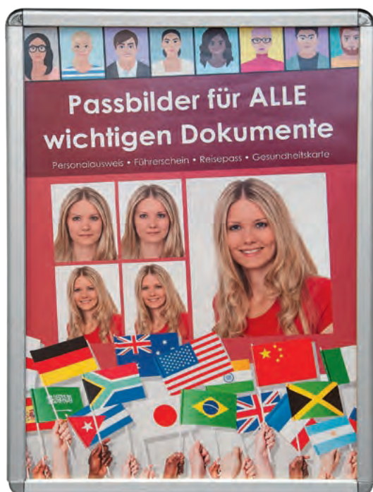
Nicht zu übersehen ist das Plakat am Verkaufstresen.