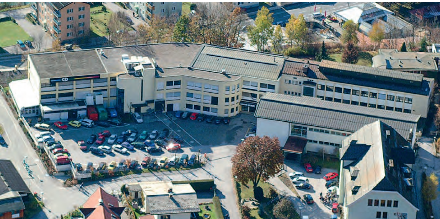
Das bekannte österreichische Fotogroßlabor residiert in Schwarzach im Pongau.