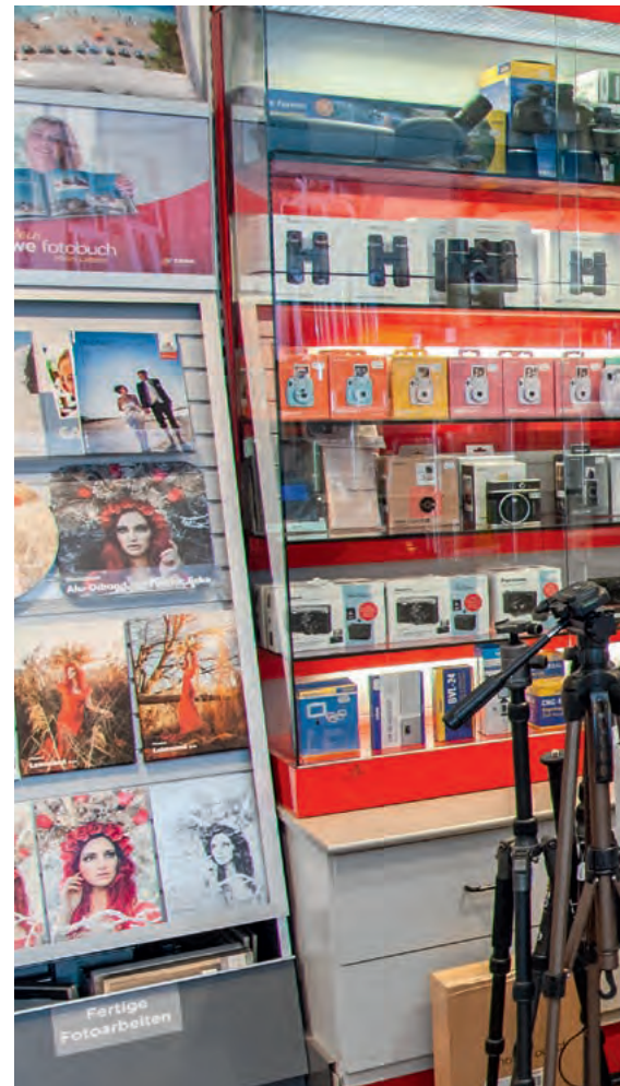
Die Thekenzone ist – wie alle Ladenbauelemente – Bestandteil des ansprechenden Ladenlayouts.

K. P. Konen: Von dieser Bestellmöglichkeit von Beginn an selbst überzeugt, haben wir die App offensiv bekannt gemacht. Konsequenterweise haben wir jedem Kunden einen selbstgedruckten 10x15-cm-Flyer mit QR-Code mitgegeben, wir haben die App über unsere Homepage, über die sozialen Medien und mit Printwerbung bekannt gemacht. Dazu kam die persönliche Ansprache unserer Kunden hier im Geschäft. Verstärkt haben wir die Kunden darauf hingewiesen, die zeitlich eingeschränkt sind. Also beispielsweise Mütter mit Kindern. Sie haben wir beispielsweise